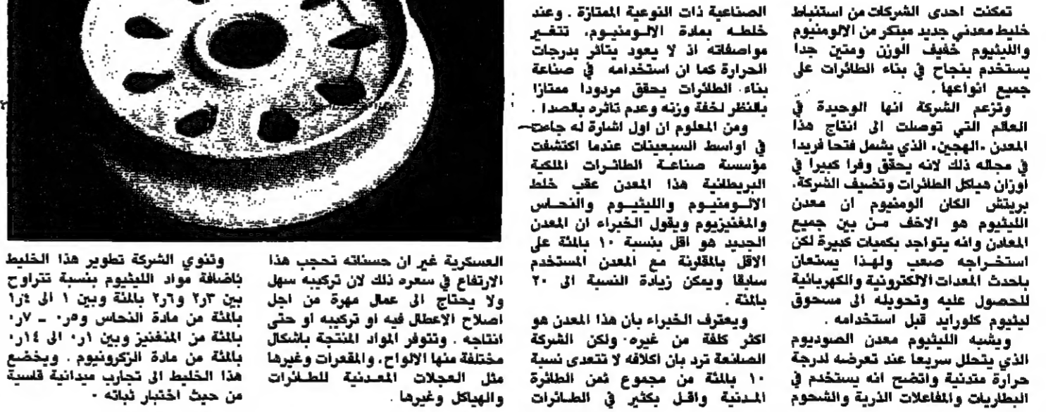
المعدنية والبيلاكل وغيرها